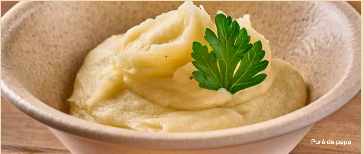
Puré de papa