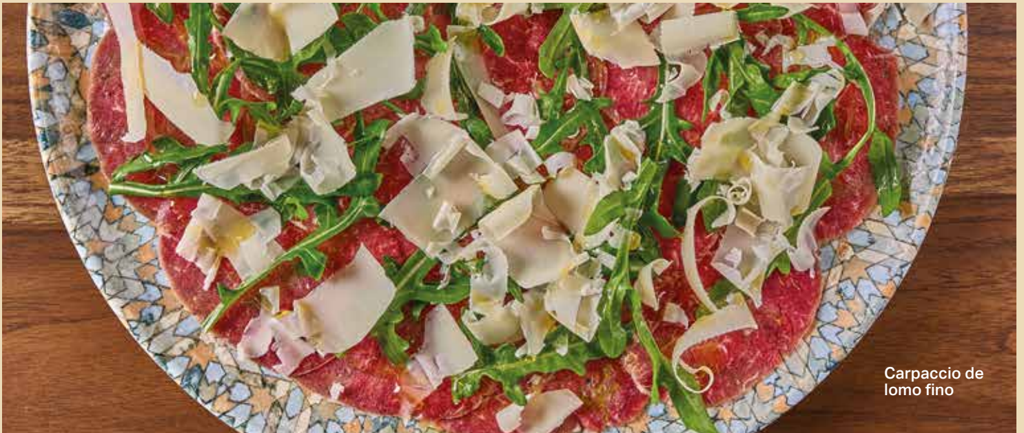
Carpaccio de lomo fino