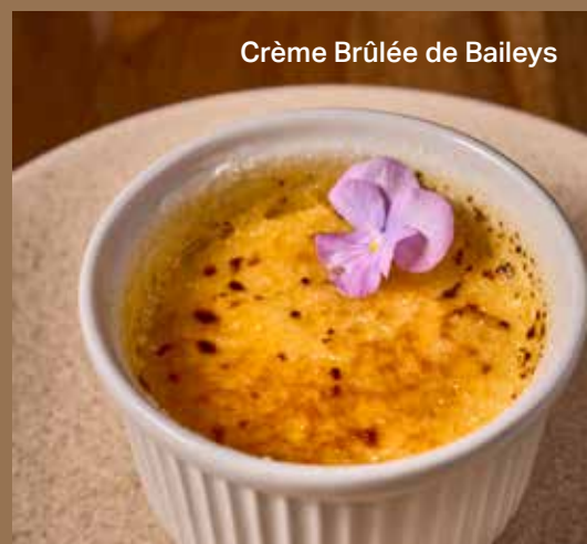
Crème Brûlée de Baileys