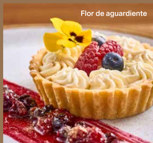
Flor de aguardiente