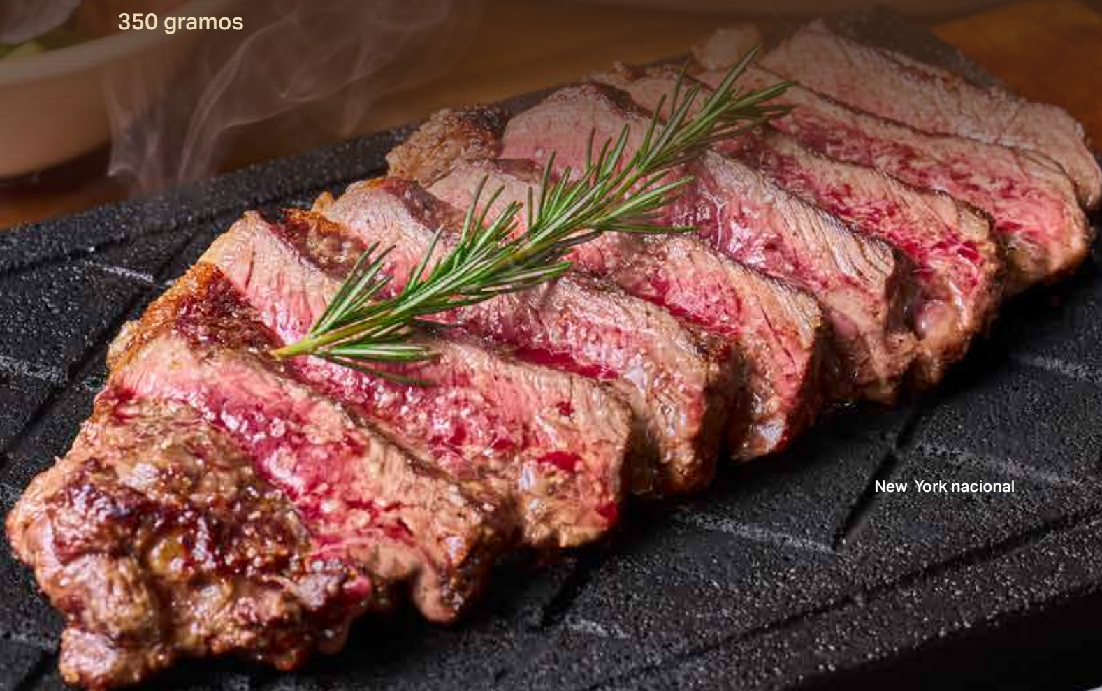
New York nacional