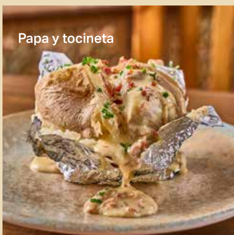
Papa y tocineta