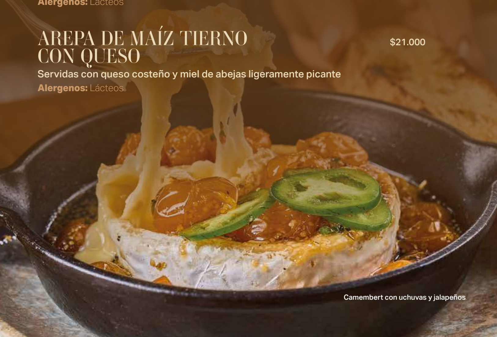
Camembert con uchucas y jalapeños